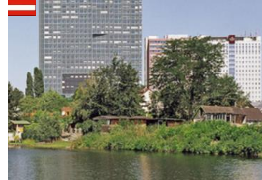
HR Summit – Digital Talent 8. Juni 2015