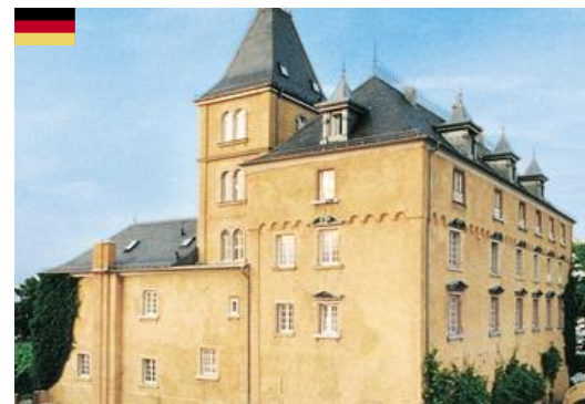
People Analytics 15. Oktober 2015