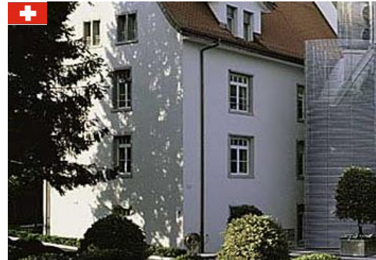
Talent Acquisition 21. Mai 2015