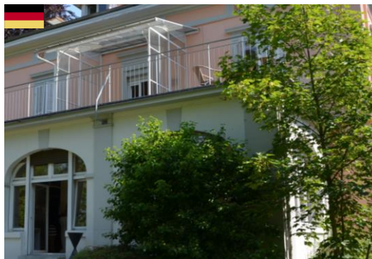
Jazz-Improvisation & Innovation 8. Oktober 2015