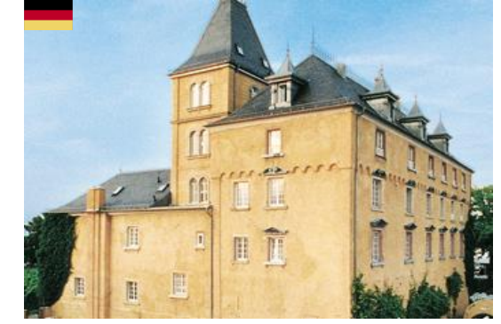
Talent: Strategie & Analytics 25.-26. Juni 2015