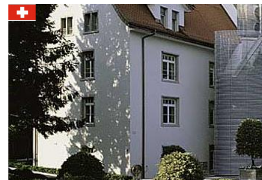
HR Strategie & Planung 29. Oktober 2015