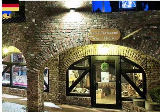
Allegro Innovations 13. Mai 2015